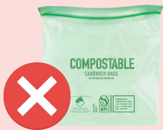
NO compostable bags