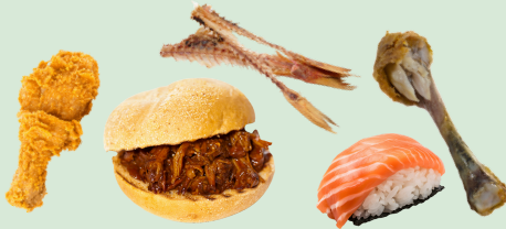
Meat, fish, and small bones*