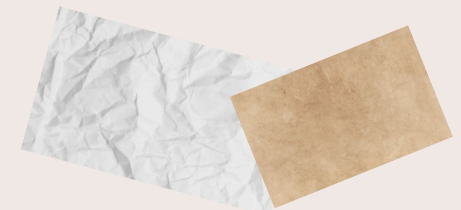
Tissue paper and plain wax paper