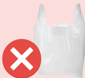
NO plastic bags