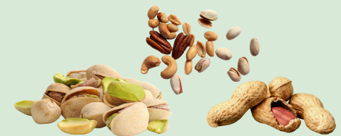
Nuts and nut shells