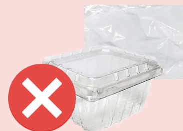
NO plastic packaging