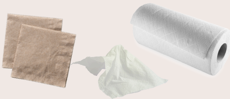
Napkins, tissues, and paper towels*