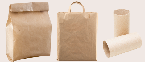
Paper bags and paper towel rolls