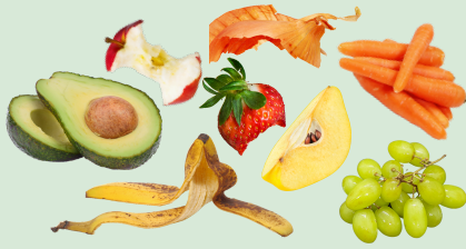
Fruits and vegetables Frutas y verduras