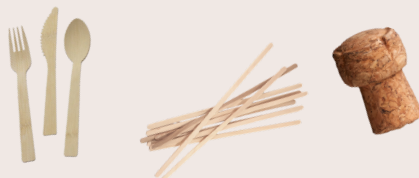
Cork, bamboo, wooden stirrers, and chop sticks