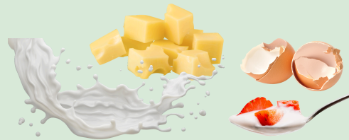
Eggs and dairy products

*No oyster or clam shells (No se permiten conchas de ostras ni de almejas)