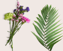
Small indoor plants and flowers