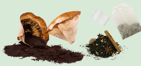
Coffee grounds, filters, and tea bags*