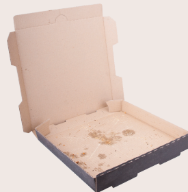
Greasy pizza boxes