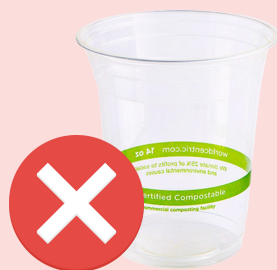
NO compostable cups

Cestas para frutas y verduras, malla y calcomanías